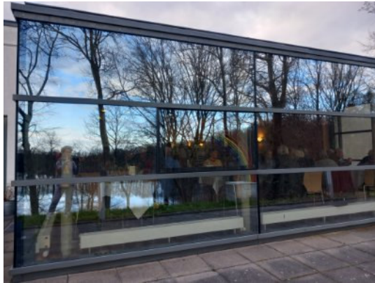
Akademie Sankelmark

Leitung: Wolfgang Teichert mit Elisabeth Jöde und Jürgen Mohrdiek in Kooperation mit der Akademie Sankelmark