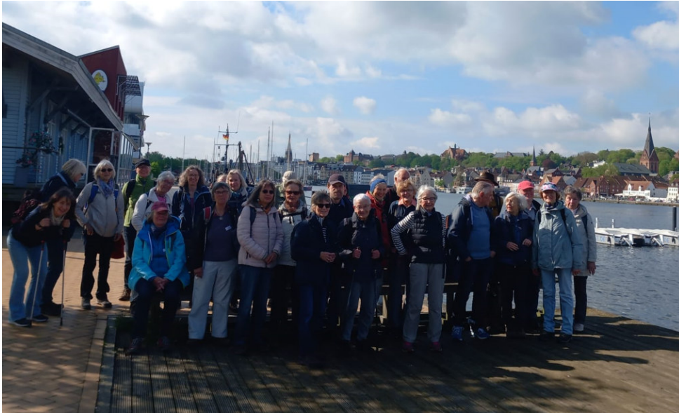
Die Pilgerschar am Flensburger Hafen