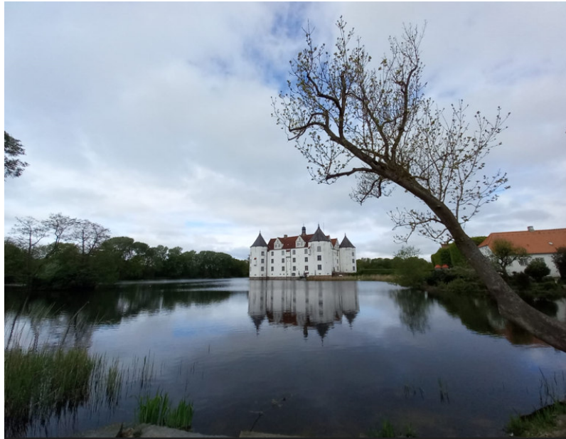
Mit anderen Augen

und aus Liebe machen wir eine Pflicht und Last. Das Leben kommt dem zu teuer, der es zu billig auffaßt. 3