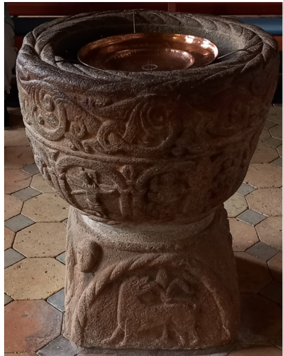
Taufstein in Hörup

Jedenfalls hören wir die fast wunderbare Geschichte einer Ankunft nach der Flucht in Glücksburg.