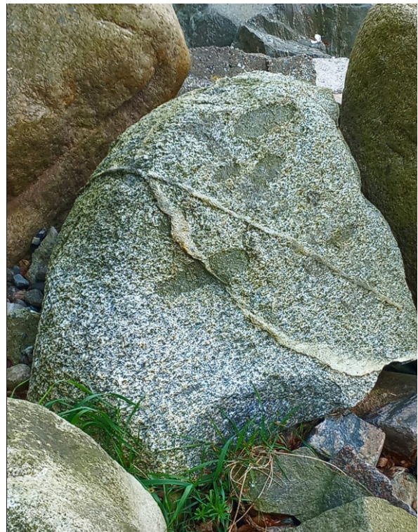
Am Wegesrand zum Schutz gegen die Fluten

Ja, wir wollten Pilgersteine am Strand sammeln, hatten uns auch eingestimmt mit dem Hinweis auf verschiedenste uralte Gesteine, hatten den Unterschied angesehen von drei Gesteinsklassen anhand ihrer Entstehung: Magmatite, Metamorphite, Sedimente, wollten Steine bemalen und Steintürmchen als kleine Mediationsübung am Strand aufbauen. Steintürmchen schützten in Norwegen vor bösen Trolen; im antiken Griechenland wurden sie dem Gott Hermes zugeordnet. Hermes schützt die Reisenden. Er wurde dem römischen Gott Merkur gleichgesetzt und später dem germanischen Gott Wotan/Odin.