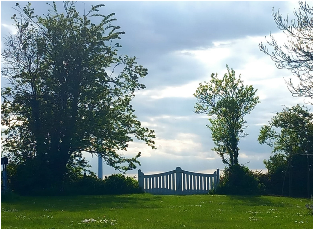
Blick aus dem Garten.

Es ist eine Ruh vorhanden für das arme müde Herz; sagt es laut in allen Landen: Hier ist gestillet der Schmerz 6 .