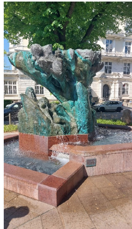
Elysium oder Paradies?

Eine Ärztin, bekannt mit einer Teilnehmerin, winkt aus dem Fenster. Überhaupt: In diesem Haus residiert heute die Psychotherapie, wie wir den Schildern entnehmen. Der Rückblick von innen auf die Haustür zeigt fast kathedralartige Fenster. Wir gehen