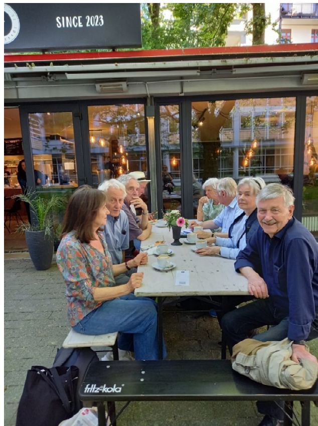
Die Stadtgängerinnen und Stadtgänger: Die „Revolution“ fiel -Gott sei Dank – aus.

Es wiederholt sich Geschichte eben nicht einfach wieder, jüdische Mitbürgerinnen und Mitbürger sollen heute, unbehelligt wie andere Bürgerinnen und Bürger auch hier in der Rothenbaumchaussee wohnen und arbeiten. Nicht zufällig sind wir bei den Juristen gelandet. Eine weiß gekleidete Studentin sitzt auf der Mauer vor dem Gebäude der Rechtswissenschaft. Sie zieht an ihrer E-Zigarette und sagt: Ich studiere Jura, damit das Recht hierzulande nie mehr gebeugt werden darf. Und am Nebentisch füttert die Cafebesitzerin ihr kleines Kind mit bestem Kuchen aus ihrem Cafe.