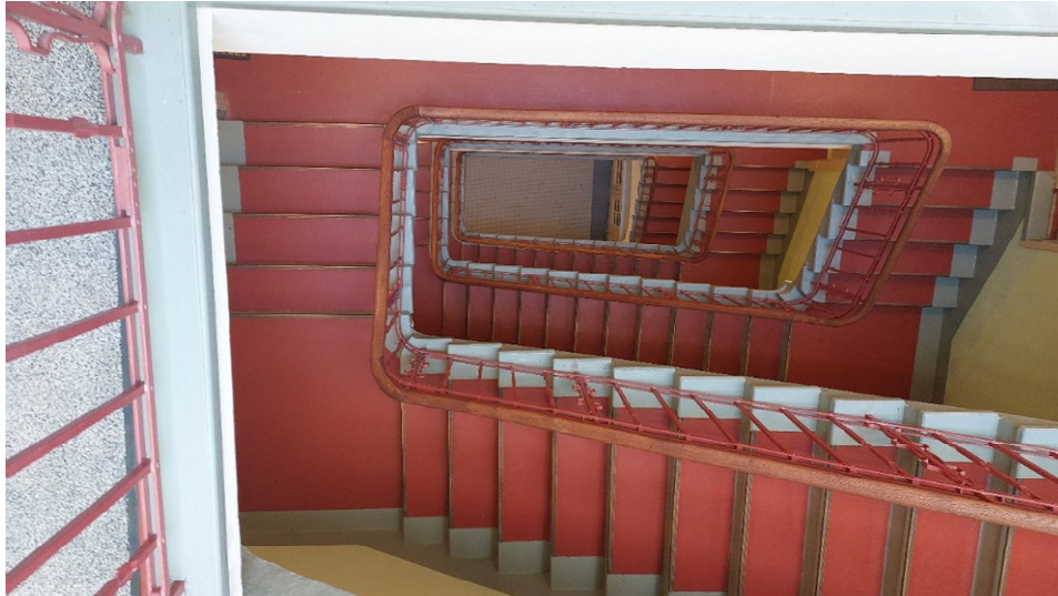
Treppenhaus Curio.

Und so werben die heutigen Betreiber für das Curiohaus: „Welcher Salon darf es denn sein? Westempore? Ostempore? Groß? Klein? Das ehrwürdige Gesellschaftshaus besitzt eine große oder zehn kleinere Eventlocation – ganz wie Sie es brauchen. Bis zu 1.500 Gäste fasst die Location. Höhepunkt: der Ballsaal im zweiten Stock. Etwas kleiner im Erdgeschoss: der Weiße Saal mit seiner umlaufenden Galerie oder der Rothenbaum Saal mit Terrasse zur Rothenbaumchaussee. Verschwenderisch: die Foyers über vier Stockwerke. Warum sich nicht einfach hier verlaufen und abwarten was passiert?“