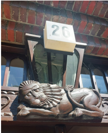
Der Eingang mit dem Löwen von Juda