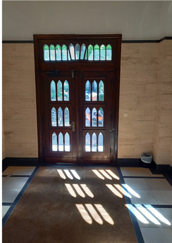
Wie eine Kathedrale oder Synagoge?