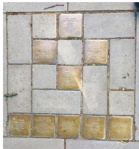
Stolpersteine vor der Rothenbaumchaussee 26

Wir verzichten hier auf die „Nachgeschichte“ und erwähnen einfach nicht mehr, wer hier eingezogen ist und trotz reichlicher „Belastung“ durch das Wirken in der Nazizeit in Hamburg nach dem Krieg unbehelligt geblieben ist.