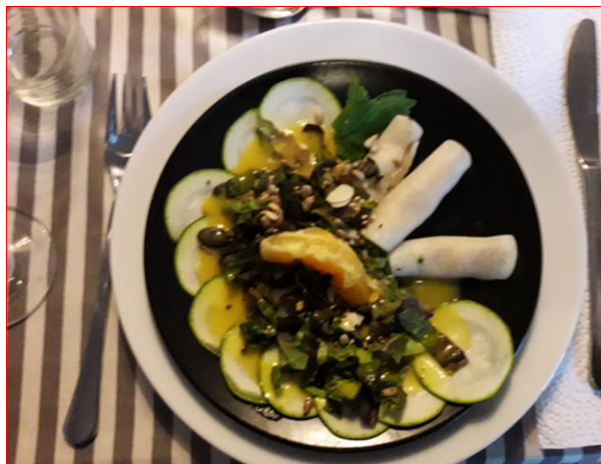
Die Vorspeise

schwer zu fassen. Einerseits wird Gott mit der Inkarnation sichtbar und tritt im wahrsten Sinn vor Augen. Andererseits ist dieses Kommen nicht leicht zu erkennen, gerade weil es so menschlich ist. Das sichtbare Erscheinen und über die Äcker wandeln hatte auch etwas Anonymes. Auf die Frage, wie „Gott“ nun in die Welt kommt, haben wir im Spiel erlebt: Er wird geboren (Purzelbaum). Genealogisch ist dabei interessant, dass der lateinische Fachbegriff „incarnatio“, der fast ausschließlich mit „Fleischwerdung“ übersetzt wird, das Wort „natio“ enthält: Geburt. Die „in-car natio“, „Ein-fleisch-ung“ geschieht als Geburt: „in-car-natio“, „In-Fleisch-Geburt“. Und wir fügen hinzu: Auf die Verwundungen der Welt reagiert er nicht, indem er sich unverwundbar hält. Vielmehr lebt er in einer gewagten Gabe, einer Hingabe seiner selbst. Er geht ein in das faktische Leben, das dem großen Risiko geschöpflichen Lebens schon immer erlegen ist. Damit setzt er sich aber auch den Mächten der naturalen, sozialen und kulturellen Zerstörungen aus.