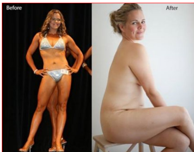
Screenshot aus Embrace von Taryn Brumfitt 2016

Zwischendrin sehen wir den australischen Dokumentarfilm Embrace - Du bist Schön von Taryn Brumfitt. Er widmet sich dem sogenannten Bodyshaming. Die nette, leicht pummelige Australierin Taryn findet es total okay, dicker zu werden. Vor allem, wenn es sich im Kontext der gar mehrfachen Mutterschaft vollzogen hat