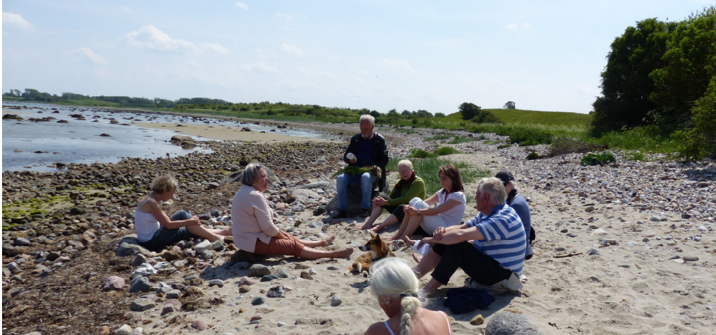
Gespräch am Strand über die Fußwaschung,