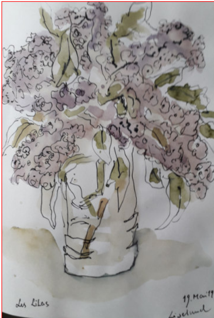
In Liselund gesehen. Aquarell: Doris Schick