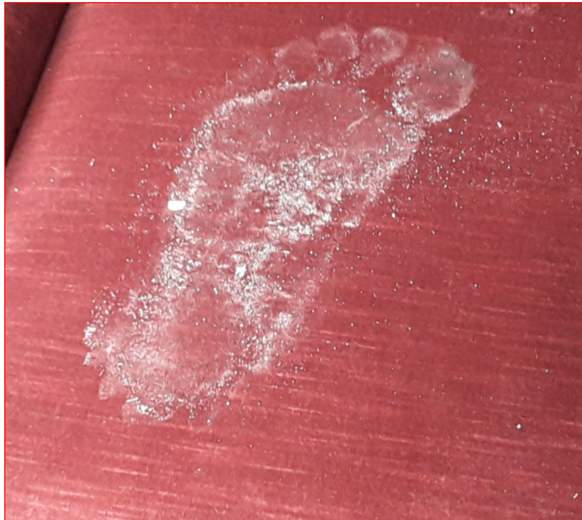
Fußspuren in einem verlassenen Haus an der Ostsee.

kam zum drittenmal, aber sie hatte so lange und so viel auf die Stümpfe geweint, daß sie doch ganz rein waren. Da mußte er weichen und hatte alles Recht auf sie verloren.