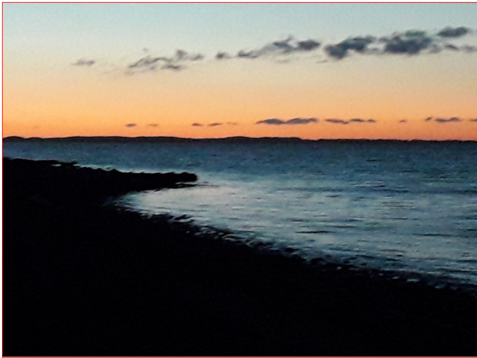
Sonnenuntergang Liselund

Sechs Tage Liselund auf Fünen im Mai: Hand und Fuß sollte unser inkarnatorisches Unternehmen haben, also im Körper ankommen. Denn, so hatten wir einmal recht geheimnisvoll bei dem Theologen Friedrich Christoph Oetinger (1702-1782), gelesen: „Leiblichkeit ist das Ende der Wege Gottes“ 1 . Einen Körper hat man, aber den Leib kann man empfinden. Was also sind die Ergebnisse unserer vielfältigen Annährungsversuche mit Lesen (biblischer Texte und einem Märchen), mit experimentellen, mimetischen Versuchen auf dem Gelände des Hauses Liselund und an Fünens Nordspitze, mit Film und Gedicht, mit Kochen und Mahlzeiten unter der großen Esche vor dem Haus? Man hätte vermuten können, wenn es um den Körper geht, wäre von den Müttern gesprochen worden. Erstaunlicherweise hatten Väter mehr Raum, bis