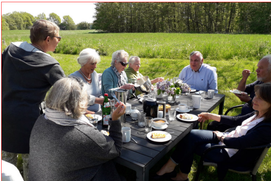
Beim Mahl im Garten

Es sei tröstlich, wie wenig die durch den Vater abgehackten Hände das Leben des Mädchens verunmöglichen konnten, fügt jemand hinzu. Das Haus im Märchen, in dem man frei wohnen kann, kann als ein Lebensraum der Anerkennung im Erwachsenenalter verstanden werden (so, dass dem Mädchen ihre Handlungsfähigkeit wieder zu wächst).