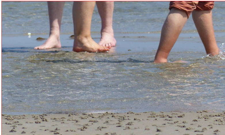
Hier wäscht die See die Füße.

Wir fragen dort am Strand: Gibt es so etwas wie Beschämung zum Guten als Intentionen dieser Handlung. Denn wer im Stuhl sitzt und sich waschen läßt, erlebt sich degradiert durch Erhöhung. Mir geschieht ein Dienst am untersten Ende meines Körpers. Die Füße sind in der Regel geschützt oder verborgen. Nackte Füße sind dem Boden und den Blicken ausgesetzt. Barfuß ist verwundbar. Ich gebe mir eine Blöße, und jemand dient mir dabei, das zu tun. Das ist eine der intimsten und menschlichsten Möglichkeiten: Sich anfassbar zu zeigen und dabei gut behandelt zu werden. Diese Mischung ist geeignet, Verhältnisse auf den Kopf oder besser: auf die Füße zu stellen. Verweigere ich mich innerlich mit den Worten Petri – »Nie und nimmer wäschst du mir die Füße!« -, bleibe ich einsam auf einer Art Thron der Unangreifbarkeit oder Untertänigkeit sitzen. Ich habe es nicht nötig, die Geste der Liebe anzunehmen.