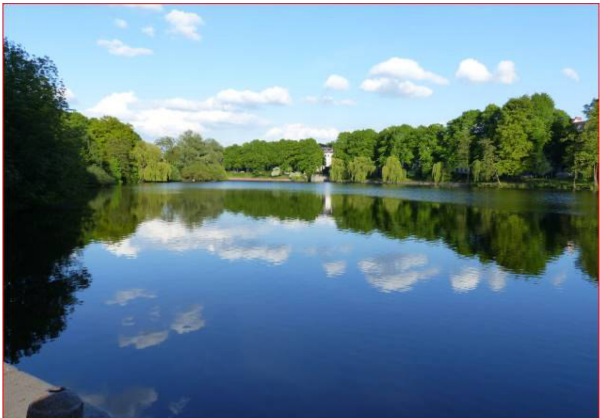
Kuhmühlenteich gegenüber Sankt Gertrud