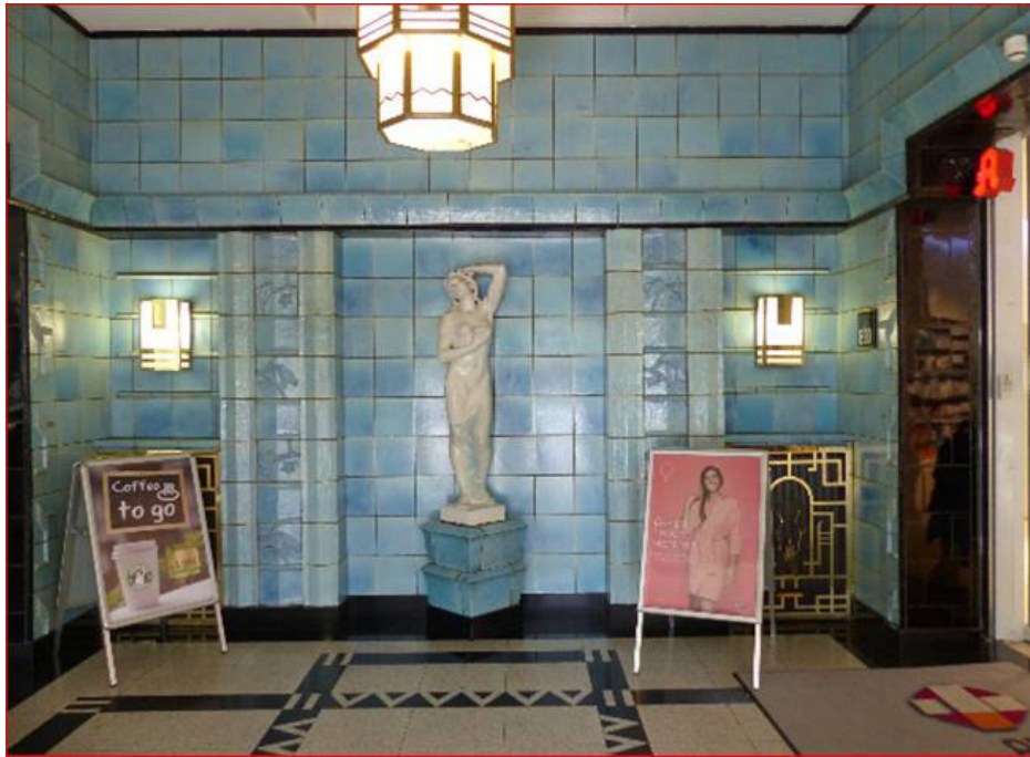
Statue im Eingang des Hammonia Bades

Es war nicht die Brücke, nicht der Eilbekkanal, auch zunächst nicht die Kirche, was vor Augen gekommen ist – zuerst. Neben dem verführerisch duftenden Jasminstrauch an der Südseite des Bahnhofs Mundsburg stehend, wandten wir uns gleich nach links zum Hammonia Bad; ein im Art Deco Stil errichteter Klinkerbau (1926-1928). Hier, so ein kundiger Mitgeher, hatte die 1890 gegründete Genossenschaft Hamburg - Altonaer Kur - und Badeanstalten, sozial und fortschrittlich wie sie damals war, "billige Bäder und Behandlungen nach den Grundsätzen der naturgemäßen Heilweise verabfolgen" wollen. Hier also hatten viele Hamburger ihre Badewanne, die ihnen zu Hause noch fehlte. Sie gingen dann immer an jener Statue vorbei, bei deren Anblick ihres wohlgeformten Köpers manche eher verzweifelt an sich herabgeblickt haben dürften. Der Name „Hammonia Bad“, so eine weitere Flaneurin, wolle wohl auf Harmonie hinweisen, die hier herrschen sollte!