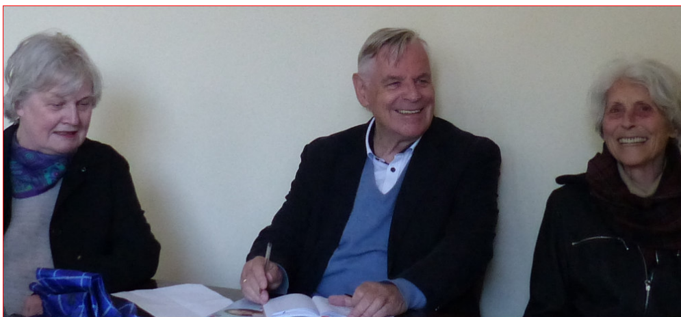
Abschluss des Stadtgangs im Cafe Soleado:

„Schütten Sie einfach noch Wasser in den Kakao“, schlagen wir vor. Sein Gesicht erhellte sich und er bringt die „Plörre“. Wenig später fragt er: „Ist alles in Ordnung?“ „Nein“, sagte besagte Mitflaneurin, „ich hätte gern noch ein bisschen Schlagsahne dazu“.