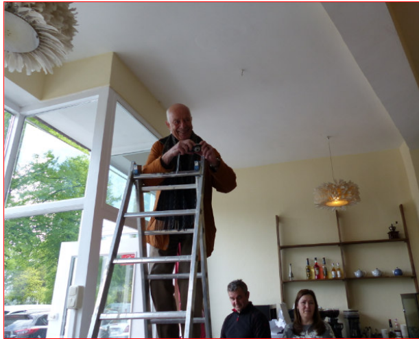
Gewagt: Fürs Gruppenfoto auf die Leiter

nimmt er freundlich lächelnd entgegen. „Haben Sie auch Kakao“, fragt eine von uns. Er nickt freundlich. „Ich meine“, fährt sie fort, „nicht so eine richtige Schokolade“ –Pause.- Der Chef schaut fragend. Sie konkretisiert: „So eine Art Kakaoplörre meine ich“. Plörre? Der gute Mann versteht nicht.