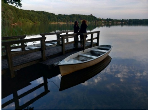
Am Ratzeburger Domsee

Welche Bedingungen braucht eine gelungene Begegnung, damit sie nicht zur Vergegnung (Martin Buber) verkommt? Wir tragen eigene Erfahrungen und Beispiele aus der Weltliteratur zusammen. Auch die Apostelgeschichte, erste und für Jahrhunderte einzige Kirchengeschichte, lebt von Begegnungen. Unter anderen eine mit der ersten Christin in Europa (Lydia), einem Wirtschaftsfachmann oder einigen Philosophen. Sie sind vergleichbar mit heutigen Rendezvous zwischen Politik, Wirtschaft, Philosophie und Religion. Einzelne Begegnungen wollen wir in diesen Tagen - im