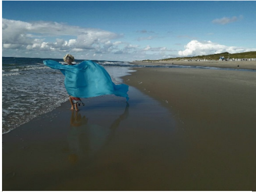
Tanz am Meeressaum