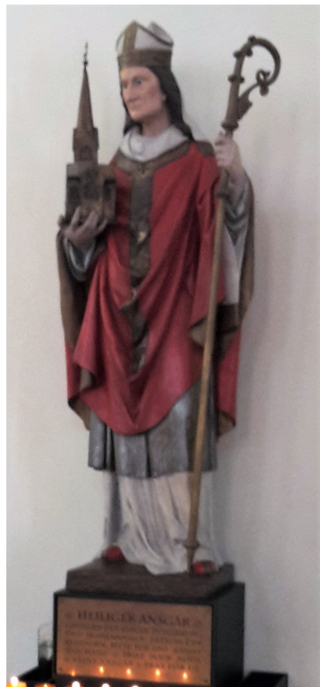
Ansgar Statue

Denn die älteste Quelle für die Gründung Hamburgs ist eine Vita, also eine Lebensbeschreibung des Erzbischofs Ansgar, von dem eine Statue nun im kleinen Michel steht.