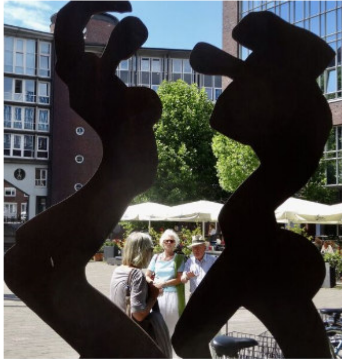
Skulptur auf dem Platz der Fleetinsel

Dienstag, 3. Juli 2018 um 15 Uhr aufgeschrieben von Wolfgang Teichert