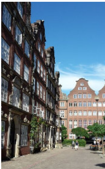
Blick ins KomponistenQuartier