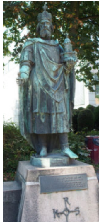
Karl der Große