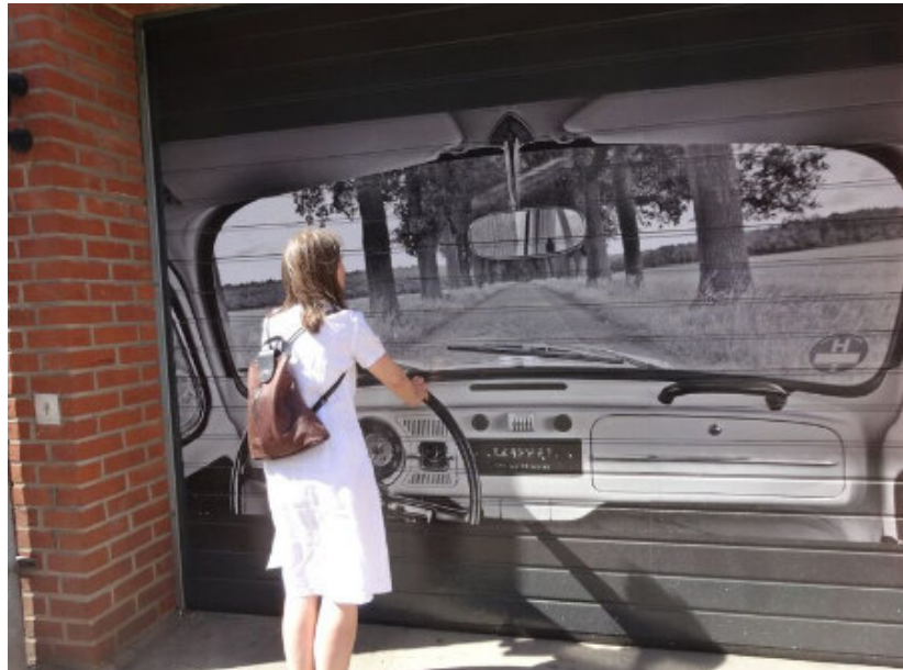
Garagentor gegenüber dem kleinen Michel