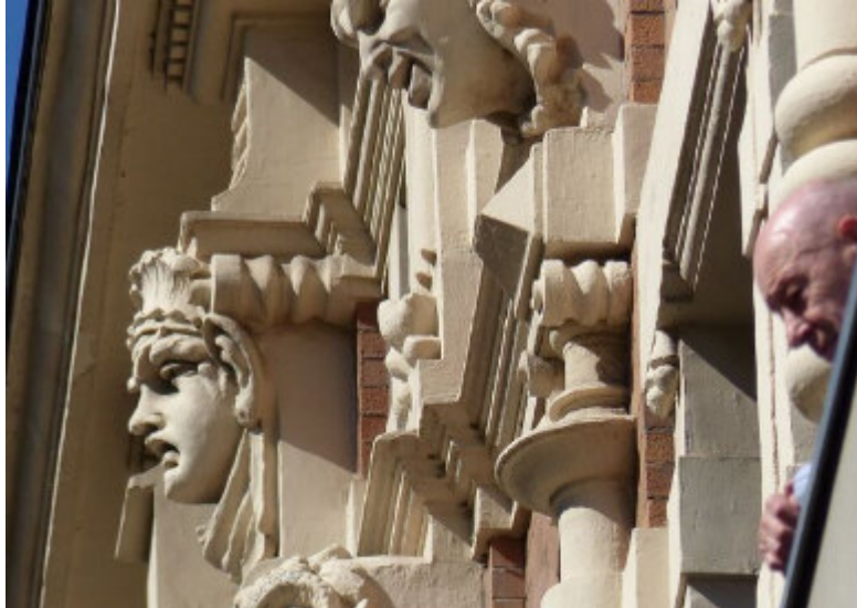
Fassade in der Poolstraße