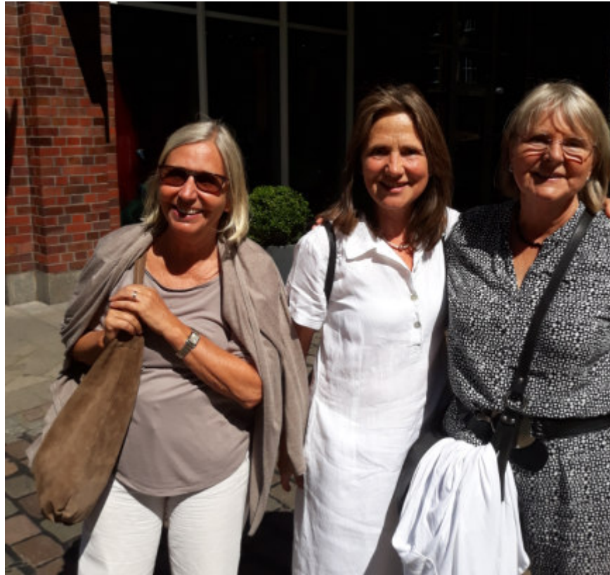
Vor dunklem Steigenberger Tor: Drei Mitflanierinnen

Start also am Steigenberger Hotel. „Hab ich schon drin übernachtet“, sagt eine ältere Mitflaniererin. „Ich bin nämlich auf der Fleetinsel am Knie operiert“. Klinik und Hotel also, wo einst nur Ödnis war (durchs Kriegsbombardement) und wo seit dem 18. Jahrhundert am Übergang von der Hamburger Altstadt zur Neustadt Packhäuser gebaut waren, denn von hier aus war ein Zugang zum Hamburger Hafen möglich.