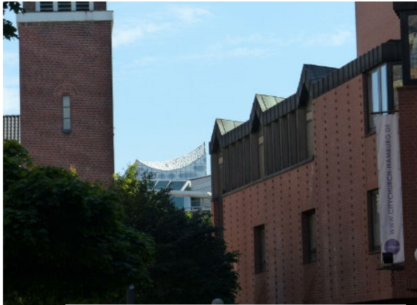
Rückblick aus der Michaelispassage