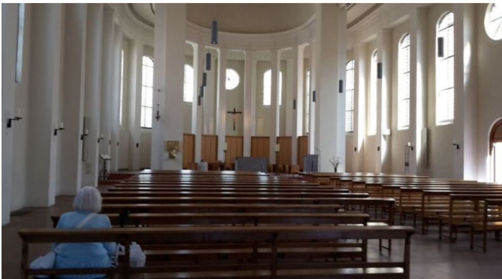
Innenraum Kleiner Michel

Wie also weiter? Wir sehen eine rote Linie über den Platz schlängelnd gezogen. Das sei der „Bummel-Hummel“ erfahren wir an der Rezeption des Steigenberger. Wenn wir „auf dem Strich“ gehen würden, dann kämen wir an den schönsten Plätzen der Neustadt vorbei; – „auf eigene Faust“, verspricht der kleine Prospekt. Wir folgen spontan dieser Linie und landen zuerst am sogenannten „Kleinen Michel“.